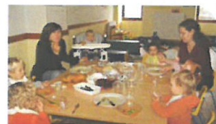
Les enfants à la halte-garderie

Les enfants habitent à Miribel ou au Gua. D'autres viennent du Col de l'Arzelier ou de Château Bernard. Les parents participent au bon fonctionnement en venant aider à l'encadrement des activités et des repas une fois par trimestre. Ainsi une douzaine d'enfants peuvent apprendre à vivre ensemble ainsi que partager le repas du midi.