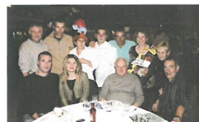
Une partie de l'équipe de LOS en soirée aux 6 jours de Grenoble

Contact : M. J-L Vallier : 06 75 63 75 25